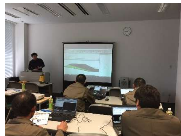
■ 以前の講習会の様子 ■