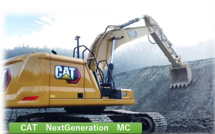
CAT NextGeneration MC